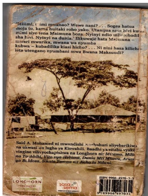
Kielelezo 1: Blabu ya riwaya ya Utengano (2009)

Uchambuzi wa Vipashio vinavyojenga blabu